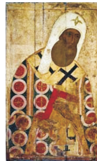
Св. Митрополит Петр

вением великим князьям Владимирским на собиране русских земель. С личностью преемника митрополита Максима – митрополита Петра – связан очень важный этап в истории Церкви и