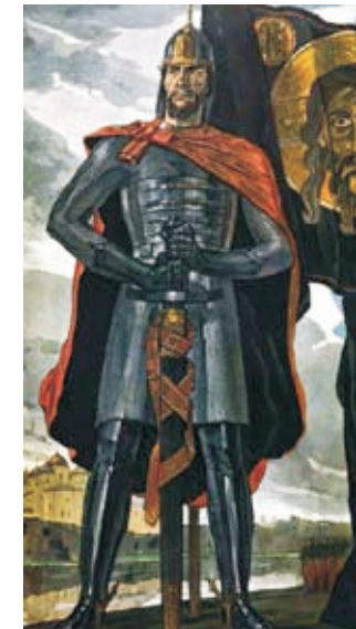
Св. блгв.кн. Александр Невский. П.Д.Корин

в католицизм. Князь Александр из двух зол выбрал меньшее. Военные подвиги князя Александра Невского, причисленного Церковью к лику святых, хорошо известны. В житии благоверного князя описываются все его военные успехи. Шведский король идет на Александра, но терпит жестокое поражение на Неве. Немецкие рыцари разбиты на льду Чудского озера, литовцы тоже чувствуют на себе руку Александра. Кратко в житии говорится о поездках в Орду. Подчеркивается верность князя православию: религиозность слита с героикой — это длинная молитва князя перед походом в Святой Софии Новгородской, небесные силы, которые помогают ему (на Неве — видение перед битвой свв. Бориса и Глеба, на Чудском озере — видение «ангельских воинств»).