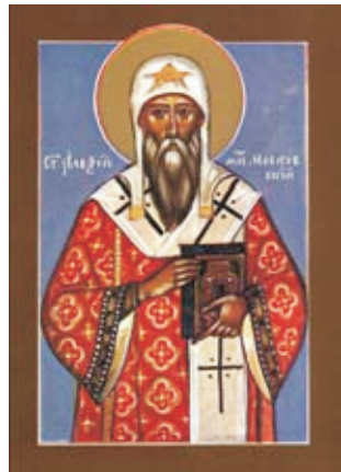
Свт. Алексий, митрополит Московский, чудотворец

привилегий. Чтобы отстоять право на привилегии, Феогност, по сообщениям источников, израсходовал на подарки монгольским чиновникам около 600 рублей – так дипломатический талант митрополита позволил Русской Церкви спокойно продолжать свою деятельность. Незадолго до своей кончины митрополит Феогност принял решение утвердить себе в качестве преемника на Киево-Московской кафедре подвижника, прошедшего 20 лет своей жизни простым монахом в Богоявленском монастыре в Китай-городе, а затем поставленного Феогностом в наместники во Владимире – будущего святителя Алексия.