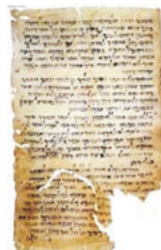
Мессиянский сборник из 4-й Кумранской пещеры

ритетность и древность Септуагинты, неискаженность текста Библии, дошедшего до нашего времени.