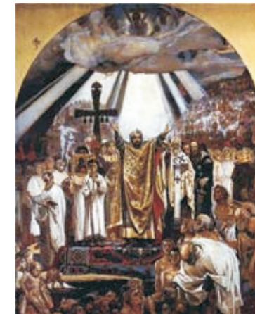
Крещение Руси. В.М. Васнецов

4. Крещение Руси при великом князе Владимире. После победы над Ярополком Владимир (963 -1015) стал княжить в Киеве. Объединив под своей единодержавной властью русские племена от Карпат и Немана и города Гродно до Белоозера, Оки и Волги, князь Владимир осознавал необходимость религиозного единства. До сих пор различные племена, населявшие Русь, поклонялись своим местным богам. Варяги почитали одних, славяне – других, финны – третьих. В 983 г. Владимир предпринимает попытку реформировать язычество: как говорит летописец, он повелел собрать воедино всех языческих богов и создал общий пантеон в Киеве из идолов Хорса, Дажьбога, Стрибога, Симаргла, Мокоши и Перуна. Пределом языческой реакции было совершение жертвоприношений идолам: в том же году после победоносного похода Владимира на ятвягов были убиты Федор и Иоанн, два варяга-христианина, отец и сын, ставшие первыми на Руси мучениками веры.