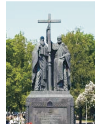
Памятник святым братьям Мефодию и Кириллу. Москва