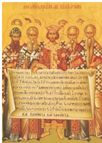
Икона «Отцы I Вселенского Собора с Символом веры»

Всего соборов было семь: первый (Никейский) – в 325 г., второй (Константинопольский, или Царьградский) – в 381 г., третий (Эфесский) – в 431 г., четвертый (Халкидонский) – в 451 г., пятый (Константинопольский) – в 553 г., шестой (Константинопольский) – в 680 г. и седьмой (Константинопольский) – в 787 г. Самыми главными на соборах были следующие вопросы: 1) тринитарный (решен 1-м и 2-м Вселенскими соборами и результат решения – догмат о Св. Троице, который вошел в Никео-Царьградский символ веры) 1 и 2) христологический (решен 3-м и 4-м Вселенскими соборами и результат решения – Халкидонский орос об Иисусе Христе).