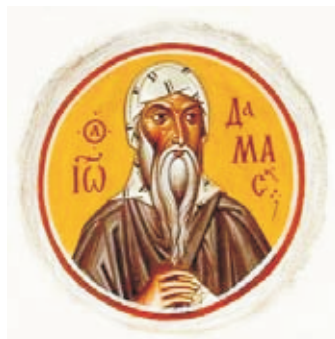
Преп. Иоанн Дамаскин Современная каноническая фреска. Худ. Г. Прядко

X век характеризуется мирной религиозностью. В житиях этого периода выступают праведники, совершавшие свой смиренный подвиг веры и любви, оставив память о множестве