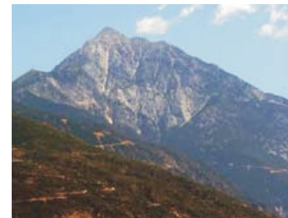
Святая гора Афон

В XIV в. в монастырях Афона происходит возрождение исихастского движения. Афонским монахам удается достичь высших духовных состояний, включающих виде-