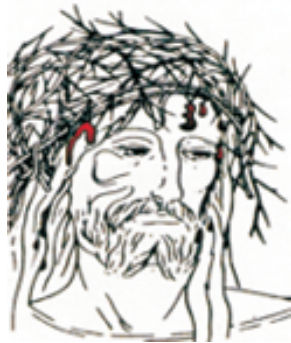
Реконструкция тернового венца Спасителя по Плащанице. Терновый венец не был обычным орудием пытки. Единственное свидетельство о его применении находится в Евангелии

но не успели обмыть, не успели стереть следы страшных страданий. Все они видны на Туринской Плащанице.