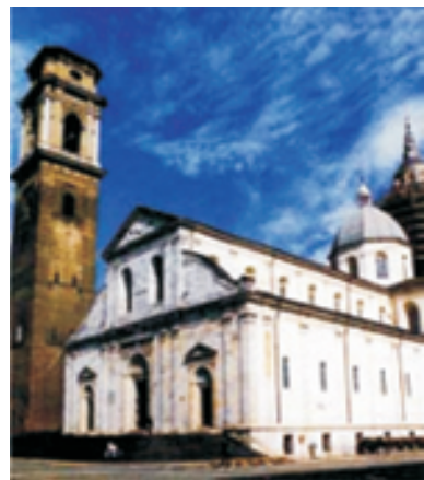
Турин. Собор во имя Пророка и Крестителя Господня Иоанна. Здесь хранится Плащаница

29), Христос явился одинадцати ученикам , среди которых был и Фома, до этого дня не успевший вернуться в Иерусалим, откуда он после распятия Учителя ушел настолько далеко, что ему понадобилось несколько дней, чтобы прийти обратно, услышав удивительную весть о Воскресении. Фома был настолько поражен реальностью воскресшего Христа, позволившего ему дотронуться до своих ран, что воскликнул: «Господь мой и Бог мой!». Христос отвечал ему на это: «Ты поверил, потому что увидел меня; блаженны не видевшие и уверовавшие» (Ин. 20:29).