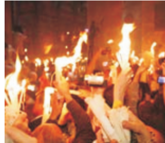
Самовозгорание свечей во время схождения Благодатного огня

ся и выходит Православный патриарх, который благословляет собравшихся и раздает Благодатный Огонь.