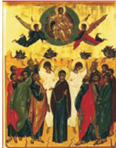
Икона «Вознесение Господне»

8 день после Пасхи в Православной Церкви называется Фоминым воскресением . В этот день, согласно Евангелиям (Ин.20:26-