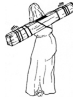
Приговоренный к распятию несет брус на спине. Реконструкция

На Плащанице видны следы монет, которые использовались при императоре Тиберии только во времена Понтия Пилата. Туринская Плащаница являет нам также следы бичевания, которое происходило до распятия. Когда Христа вели на Голгофу, Он был слаб настолько, что Сам не мог нести свой крест. На Голгофе, на месте казни, уже были врыты в землю столбы, которые стояли там постоянно, а каждый человек, приговоренный к казни, должен был принести поперечную перекладину, к которой прибавались его руки. Такой деревянный брус полагался на спину человека, и, чтобы он не убежал, его руки за спиной привязывались к этому деревянному бруску.