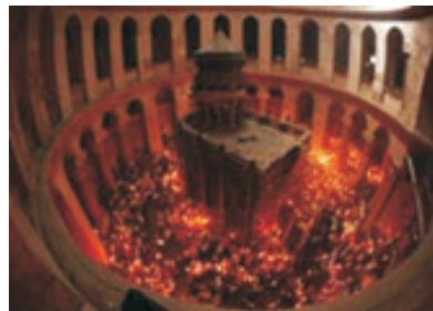
Схождение Благодатного огня по стенам храма Воскресения Христова в канун православной Пасхи.

Храм или отдельные его места заполняются не имеющим аналогов сиянием, которое, как полагают, впервые явилось во время Воскресения Христова. В это же время двери Гроба открывают-