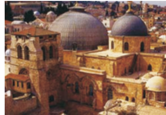
Храм Воскресения Христова (Гроба Господня). Иерусалим.

Церковная церемония обретения Святого Огня начинается приблизительно за сутки до начала Православной Пасхи. Все свечи и лампы в храме Воскресения тушат. На середине ложа Живоносного Гроба ставится лампада, наполненная маслом, но без огня. По всему ложу раскладываются кусочки ваты, а по краям – прокладываются лента. Так приготовленная, после осмотра еврейской полиции, Кувуклия (Часовня над Гробом Господним) закрывается и опечатывается местным ключником-мусульманином.