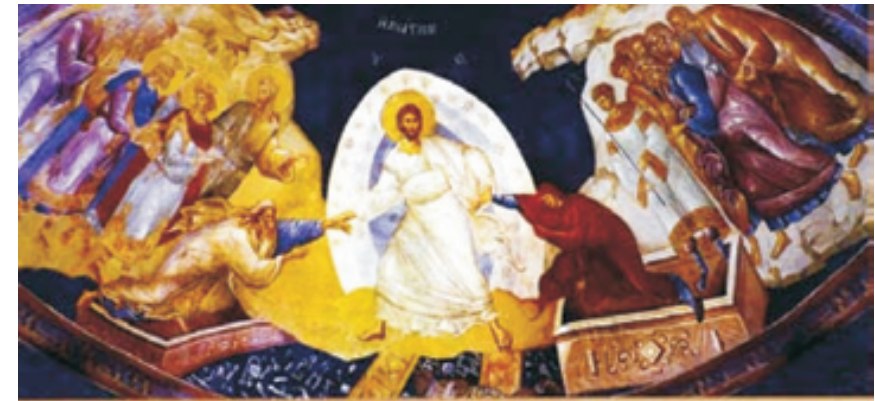
Фреска «Воскресение Христово»

Прошло две ночи и один день, а на следующее утро ученицы Христа, полные скорби от потери любимого Учителя, направились к гробнице, чтобы обмыть Его тело и совершить полностью все по-гребальные обряды. Эти ученицы в православной традиции назы- ваются женами-мироносицами, и память их совершается во второе воскресение после Пасхи. Это Мария Магдалина, Мария Иаковле- ва (мать апостолов Иоанна Богослова и Иакова), Марфа и Мария (сестры Лазаря), Саломия, Иоанна, жена домоправителя Ирода Хузы и другие благочестивые женщины. Мария Магдалина, опере- див прочих женщин и подойдя ближе к пещере Гроба, обнаружила, что камень отвален от Гроба (Ин.20:1). Евангелист Матфей пишет, что когда «пришла Мария Магдалина и другая Мария посмотреть