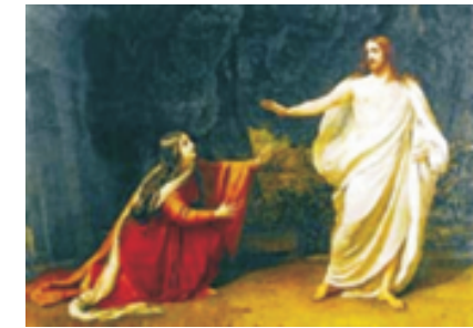
Картина А.А.Иванова «Явление Христа Марии Магдалине после Воскресения», 1834 - 1835 гг.

В этот же день Христос явился двум ученикам – Луке и Клеопе. Это произошло на дороге в Еммаус* в несколь- ких верстах от Иерусалима. Ученики также узнали Учи- теля не сразу, не во время бе- седы, пока они вместе с Ним шли по дороге, а на трапезе по характерному лишь Ему дви- жению рук во время прелом- ления хлеба (Лк.24:13-31). В тот же день вечером Христос явился десяти ученикам в запертой горнице в тот момент, когда Клеопа и Лука после встречи с вос-