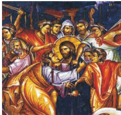
«Предательство Иуды». Фреска монастыря Ватопед на Афоне. XIV в.

Что означал поцелуй Иуды ? Первосвященники, очевидно, боясь народного возмущения, дали приказ Иуде взять Иисуса осторожно.