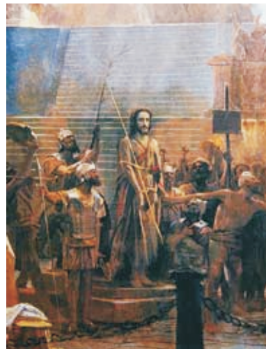
Фрагмент картины И.Н.Крамского «Радуйся, Царю Иудейский!», 1877-1882гг.

Прокуратор делает попытку вызвать в иудеях чувство жалости. Бичевание, которому он подвергает Иисуса в этот момент, объясняется именно этими побуждениями. Для бичевания воины отвели Иисуса в преторию, т.е. внутрь двора. Они раздели Иисуса и начали бичевать Его (Ин.19:1). Такое наказание назначалось у римлян за тяжкие преступления, причем в основном для рабов. Бичи делались