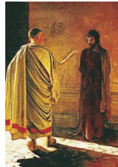
«Что есть истина?» Христос перед Пилатом. Картина Н. Ге (1831-1894)

Иисус из Назарета был представлен Синедрионом на суд по обвинению в политическом преступлении: возмущении народа, призыве не платить подать кесарю и усвоении Себе достоинства Христа-Царя. В своей политической части обвинение было неоправданное, но оно было необходимо, чтобы получить от Пилата утверждение приговора.