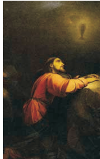
Картина Ф.А.Бруни «Моление о чаше», 1835 г.

Далее, пишет евангелист, «возмущившись духом» от сознания, что тут же присутствует Его предатель, Христос сказал с горечью: «Истинно говорю вам, один из вас предаст Меня» (Ин. 13:21). Эти слова вызывали смя-