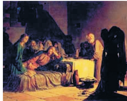
Картина Н.Н.Ге «Тайная вечеря», 1863 г. Художник изобразил уход Иуды

В Великую Среду Православная Церковь вспоминает помазание Христамиром 1 неизвестной женщиной (по преданию, раскаявшейся грешницей) в доме Симона прокаженного (т.е. Симона, исцеленного Христом от проказы) в Вифании и последовавшее за этим предательство Иуды (Мф. 26:6-15). Когда Христос вместе с учениками совершал трапезу, в дом вошла женщина с алавастровым 2 сосудом, наполненным миром. Женщина возлила миро на голову Христа. Увидев это, ученики Его (по свидетельству евангелиста Иоанна, Иуда) «вознегодовали и говорили: к чему такая трата? Ибо можно было бы продать это миро за большую цену и дать нищим. Но Иисус, уразумев сие, сказал им: что смущаете женщину? она доброе дело сделала для Меня: ибо нищих всегда имеете с собою, а Меня не