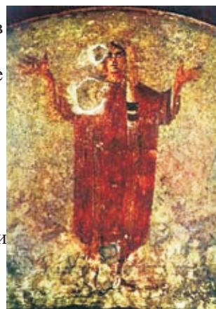
Оранта. Фреска катакомбы Присциллы. Рим, II в.

Изображения Богородицы в катакомбном искусстве. Изображения Богородицы в катакомбах почти так же многочисленны, как изображения Спасителя. Но если Христос в основном изображается символически, то Богоматерь – прямо и непосредственно. Наиболее древнее дошедшее до нас изображение Богородицы относится ко II в. Часты изображения в виде Оранты , то есть изображения Богородицы в полный рост с воздетыми в