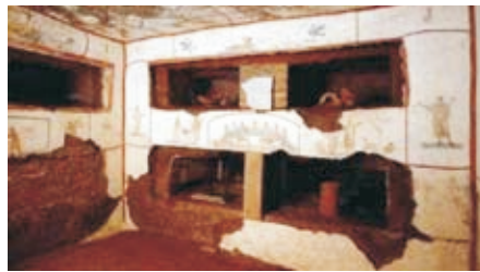
Катакомбы мученика Себастиана