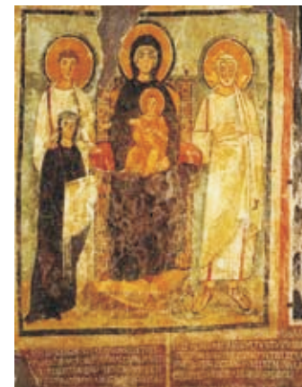
Раннехристианское изображение Богородицы с богомладенцем Христом (Римские катакомбы)

молитве руками. Такие изображения подчеркивают представление христиан о роли Богородицы как Предстательницы пред Богом за Церковь и за мир. В таком именно виде и изображается она на донышках богослужебных сосудов, в большом количестве найденных в катакомбах. Иногда рядом с Ней изображаются Апостолы Петр и Павел. В римских катакомбах к настоящему времени открыто также не менее 12 изображений II–IV вв. сцены поклонения волхвов, в которой Богородица, принимая поклонение, всегда сидит, держа Младенца на коленях.