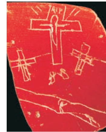
Древнейшее открытое изображение креста с распятием, III в., Испания

Недавние археологические раскопки 2006 г. в Испании подтвердили факт существования открытых изображений распятия в III в.: на севере Испании, в местечке Ирука-Велея было обнаружено около 270 рисунков и надписей III в. на баскском языке и на латыни. Среди этих изображений находится, хотя и примитивное, но совершенно отчетливое изображение креста с Распятым, с надписью над Его головой, двумя крестами по бокам и двумя фигурами у подножия. Радиоуглеродный анализ, сделанный независимо в лабораториях университетов Тулузы и Гронингена, подтвердил датировку этого черепка третьим веком.