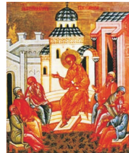
Отрок Иисус учительствует в храме. Новгородская икона XV в.

Когда Отроку исполнилось двенадцать лет, родители взяли Его в Иерусалим на праздник Пасхи. По закону Моисея, все иудеи мужского пола обязаны были три раза в год являться в Иерусалим на праздник Пасхи, Пятидесятницы (праздник дарования Десяти заповедей) и Кушцей (праздник сбора урожая); исключение делалось только для детей и больных. Особенно строго требовалось посещение Иерусалима на праздник Пасхи. Отрок, достигший двенадцати лет, становился «чадом зако-