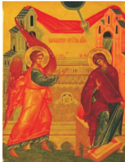
Икона «Благовещение Богородицы»

1. Благовещение Девы Марии (Лк.1:26-38). Рождению Христа предшествовало чудесное событие: «Послан был Ангел Гавриил от Бога в город Галилейский, называемый Назарет, к Деве, обрученной мужу, именем Иосифу, из дома Давидова; имя же Деве: Мария». Услышав обращенное к ней приветствие, Дева смутилась, и тогда Ангел сообщил Ей волю Создателя: «И вот, зачнешь во чреве, и родишь Сына, и наречешь Ему имя: Иисус. Он будет велик и наречется Сыном Всевышнего, и даст Ему Господь Бог престол Давида, отца Его; и будет царствовать над домом Иакова во веки, и Царству Его не будет конца. Мария же сказала Ангелу: как будет это, когда Я мужа не знаю? Ангел сказал Ей в ответ: Дух Святой найдет на Тебя, и сила Всевышнего осенит Тебя; посему и рождаемое Святое наречется Сыном Божиим».