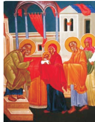
Фреска «Сретение Господне»

Знаменательная эта встреча вошла в календарь Православной Церкви как один из двенадцатых праздников и носит название