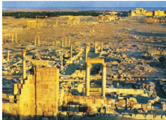
Развалины греческого полиса Пальмира в Сирии

1. Основные культурные особенности Древнего мира в канун Рождества Христова. Начиная с эпохи завоеваний Александра Македонского (III в.) Древний мир постепенно эллинизировался. Эллинизация была следствием походов великого завоевателя, со времени которых началось широкое распространение эллинской (греческой) культуры через устройство в разных городах империи греческих поселений – полисов. Греческий язык стал международным.