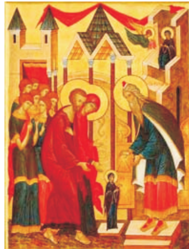
Иконы «Рождество Богородицы», «Введение во храм Богородицы»

Родители Девы Марии вскоре после этого события умерли. Дева Мария воспитывалась при храме до 14 лет. Находясь в храме, Дева Мария, как все еврейские девушки, обучалась ремеслам, но, кроме того, читала священные книги, ведя в основном уединенный образ жизни. Благочестивая обстановка храма способствовала тому, что еще до 14 лет Дева Мария приняла обет безбрачия. Протоевангелие Иакова повествует о том, что в 14 лет, когда девушек по обычаю того времени выдавали замуж, священники Храма были вынуждены созвать совет представителей 12 израилевых колен, на котором был брошен жребий, касающийся того, кому надлежит забрать под свое покровительство Деву, выбравшую для себя столь необычный для того времени подвиг. Жребий пал на старца - вдовца Иосифа, которому было уже около 80 лет. От первой жены старец Иосиф имел сыновей, которые в Евангелиях называются братьями