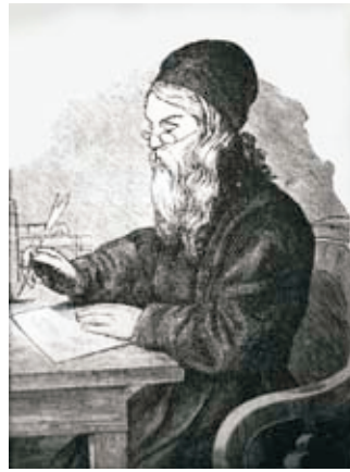
Преп. Макарий Глухарев. Гравюра XIXв.

ни. Здесь существовало язычество, был развит шаманизм, богам приносились кровавые жертвы. С одной стороны, алтайцы отличались честностью, наивным прямодушием, миролюбием, гостеприимством, но, с другой стороны, кочевой уклад жизни способствовал развитию у них лени и пьянства. Труд у кочевников считался постыдным, низким занятием; им была свойственна почти полная апатичность, отсутствие каких-либо духовных интересов и потребностей. Все это отразилось на умственных качествах алтайцев: большинство местных жителей