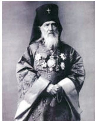
Свт. Николай Японский

Сначала проповедь Евангелия в Японии казалась совершенно невыносимой. Восемь лет ушло у о. Николая на то, чтобы изучить страну: народ, язык, нравы и обычаи. В 1869 г. Св. Синодом было принято решение образовать «для проповеди между японскими язычниками особую Российскую Духовную Миссию», начальни-