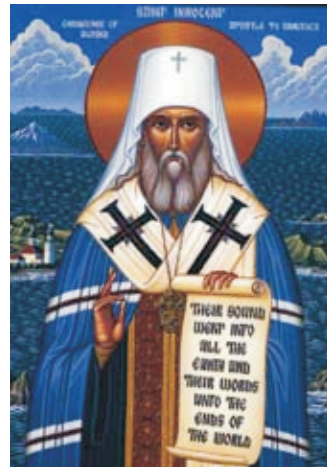
Свт. Иннокентий Вениаминов

Апостол Америки и Сибири – святитель Иннокентий (Вениаминов) (1797–1879) – был родом из села Ангинское Иркутской епархии. Рано оставшись сиротой, будущий миссионер самостоятельно изучил грамоту и в семь лет уже прекрасно читал за богослужением. Прихожане уговорили его мать отдать сына в ученье, и он был принят в Иркутскую семинарию на казенный счет. Окончив ее с отличием, Иоанн женился и был рукоположен в сан священника, а вскоре после этого со всей семьей добровольно поехал для миссионерской деятельности на Алеутские острова. Несмотря на кратковременность проповеди первых русских миссионеров, Православие в этих краях имело большой успех. Но в виду отсутствия поддержки из России, продолжатели дела преп. Германа Аляскинского были в большом затруднении.