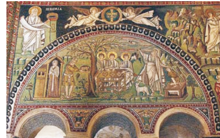
Приход Трех Странников к Аврааму и жертвоприношение Исаака. Мозаика, VI в. Церковь Сан-Витале, Равенна, Италия

3. Отражение библейских событий, связанных с историей жизни Авраама, в православной традиции. Самой удивительной историей, которая сошла со страниц Библии на православные иконы (например, «Святая Троица» А.Рублева), и в православной традиции связана с ветхозаветным прообразом Бога в представлении христиан – Бога-Троицы, является история посещения тремя странниками шатра Авраама . Приветливо встреченные Авраамом, необычные странники предсказывают ему рождение сына (Аврааму, как утверждает Священное Писание, в это время было 99 лет). Сказав это, странники просят Авраама пригласить в шатер жену – девяностолетнюю Сарру, которая по обычаям того времени не имела права