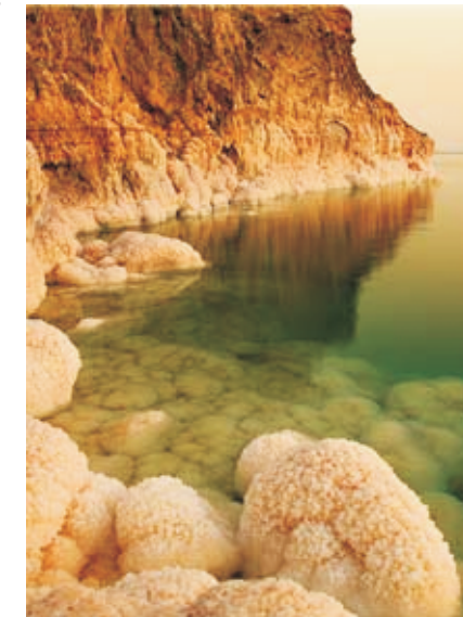
Побережье Мертвого моря

С именем патриарха Авраама связано библейское сказание о Лоте, его племяннике, с которым Авраам расстался после возвращения из Египта по поводу того, что у обоих за время пребывания в Египте накопился многочисленный скот, что стало приводить к спорам между пастухами. Авраам предложил своему племяннику выбрать любую часть земли Ханаан, и Лот выбрал окрестность Иорданскую. Это была плодородная долина реки Иордан - местность вокруг Мертвого моря*. Сейчас это наиболее жаркий район Палестины, где температура достигает 40-50 °С. Исследования археолога Н.Глюка показали, что Иорданская долина в годы Авраама была густо населена. Лот поставил шатры в Содоме. С библейским сказанием о Содоме свя-