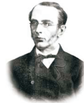
К.П. Победоносцев (1827-1907)

При Александрe II обер-прокурор граф Д.А.Толстой впервые низвел преподавание Закона Божия в школах до второстепенного предмета.