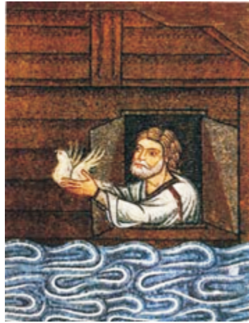
Ной выпускает голубя из ковчега. Фрагмент мозаики к. XII - нач. XIII вв. Венеция, собор св. Марка

Согласно библейскому тексту, дождь, обрушившийся на Землю, продолжался 40 дней, а затем «разверзлись все источники великой бездны» (Быт. 7:11) и 150 дней прибывала вода. Спустя 5 месяцев после начала потопа Ковчег остановился в районе Араратских гор. После того, как постепенно вода «убыла», три сына Ноя и их жены вместе с Ноем возвратились в великую долину Тигра и Евфрата*.