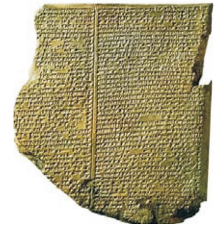
11-я табличка ассирийской редакции «Эпоса о Гильгамеше» с историей о Великом потопе

Одним из ярких сказаний небиблейского происхождения о потопе является месопотамский миф, содержащийся в вавилонском эпосе о Гильгамеше . Историко-культурный сравнительный анализ этого древнего памятника Ближнего Востока, дошедшего до нашего времени на клинописных табличках, и библейского текста о Потопе позволяет сделать выводы о самой тесной связи между ними. Благодаря расшифровке отрывка эпоса о Гильгамеше человечеству впервые стало известно о существовании древнего аналога библейского сказания.