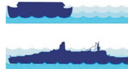
Сопоставление размеров Ноева ковчега и современного тихоокеанского лайнера

Нравственное значение Потопа в библейском понимании заключается в том, что он был послан человечеству как наказание за всеобщее моральное разложение.