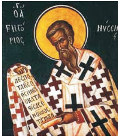
Свт. Григорий Нисский, IV в.

нии, ибо одинокое существование не отражает Бога. Примечательно, что, когда жена приводится к Адаму, то первой реакцией его было восклицание, которое более точно переводится с древнееврейского языка междометием не «вот», а «ура!» («вот это плоть от плоти моей, кость от кости моей») (Быт. 2:23). К интересным выводам можно также прийти, исследуя этимологию слова «ребро» в тексте о сотворении жены. В переводе с древнееврейского оригинала это слово означает не только «ребро»,