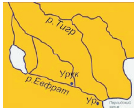
Междуречье Тигра и Евфрата

Примечательно, что в данных стихах находятся географические координаты Эдема: указано, что он, во-первых, был на востоке, во-вторых, из Эдема выходила река, разделявшаяся далее на четыре реки: Фисон, Гихон, Хиддекель, Евфрат*. Название Хиддекель – это древнееврейское наименование реки Тигр*, а река Евфрат на современной географической карте по-прежнему называется своим библейским именем. Исходя из этого, можно предположить, что Эдемский сад находился в районе Междуречья (Месопотамии*).