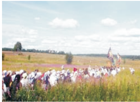
Иринарховский крестный ход по Ярославской земле — восстановление исторической памяти и традиции

боярам и к казацкому войску учительную грамоту, чтобы они стояли крепко за веру и не принимали Маринкина сына на царство — я не благословляю. Да и в Вологду пишете к властям о том, и к Рязанскому владыке: пусть пошлет в полки учительную грамоту к боярам, чтобы унимали грабеж, сохраняли братство и как обещались положить души свои за Дом Пречистой, так же и совершили. Да и во все города пишете, что сына Маринки отнюдь не надо на царство; везде говорить моим именем».