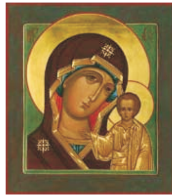
Икона Божией Матери Казанская

Ермоген стал священником в г. Казани в 1579 г. и в том же году явился свидетелем обретения чудотворной Казанской иконы Богоматери. Пожар 1579 г. уничтожил половину кремля,