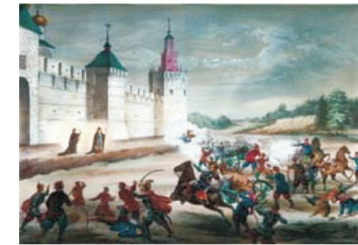
Осада Троице-Сергиевой Лавры. Литография. 1870 гг.

Кроме стрельцов активное участие в обороне монастыря принимали способные носить оружие монахи, среди которых были бывшие воины, монастырские служители и крестьяне соседних сел. Возглавлял оборону монастыря настоятель — архимандрит Иоасаф.