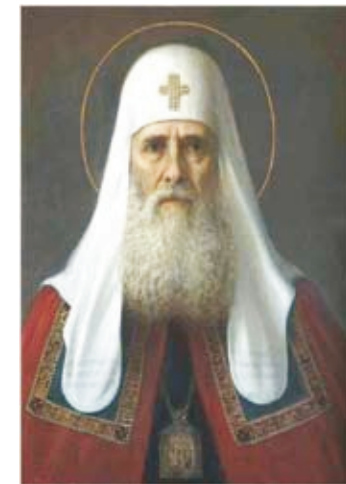
Патриарх Иов - первый патриарх Московский и всея Руси

Патриарх Иов правил Русской Церковью с 1589 по 1605 гг. Это был человек выдающихся личных способностей. В 1598 г. после смерти царя Феодора он стал на сторону Бориса Годунова, избранного новым государем. Но в русском обществе многие считали этого царя «незаконным». Надвигалась смута. В это время после ряда неурожайных лет в России свирепствовал страшный голод, страна погружалась в хаос. И в этом хаосе явился в 1603 г. Лжедмитрий I . Он объявился на Западе, в Польше, и умело сыграл на желании русских людей иметь законного царя. Самозванец объявил себя «царевичем Димитрием», чудом спасшимся в 1591 г. от рук убийц. Лжедмитрия поддерживала не только польская знать, но и папа Римский, видевший в нем средство приведения русского народа в лоно Католической Церкви, о чем он вполне определенно писал самозванцу.