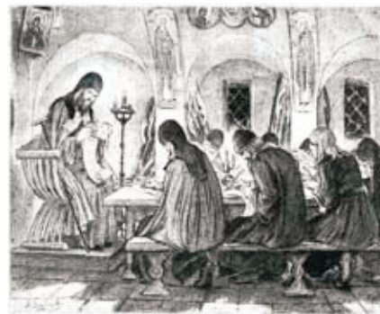
Переписка патриотических грамот в Троице-Сергиевой Лавре с призывом выступить против интервентов Худ. А. Васнецов, 1911 г.

После снятия осады Троице-Сергиева Лавра стала во главе национального сопротивления. Настоятель обители, архимандрит Дионисий вместе с Авраамием Палицыным во время заключения патриарха Ермогена рассылал во все стороны одно за другим патриотические воззвания. В них описывалась несчастная судьба первопрестольной Москвы, неволя патриарха Ермогена, русские люди призывались вос-