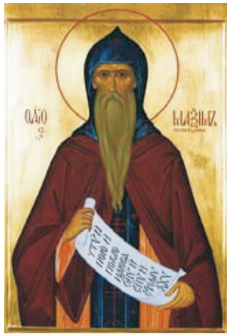
Преп. Максим Исповедник (VII в.)

телесными очами, бессмертная, одаренная разумом и умом, не имеющая определенной фигуры; она действует при помощи органического тела и сообщает ему жизнь, возрастание, чувство и силу рождения».