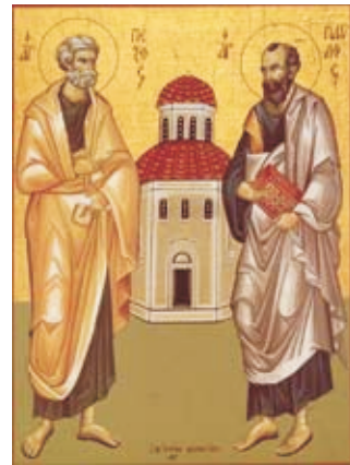
Св. апостолы Петр и Павел

Негативное отношение к христианам со стороны римской власти в правовом смысле усиливалось также тем, что христиане отказывались воздавать почести не только божествам, но и императору. Римский император был верховным охранителем римских «сагга» (лат. «сагга» – священное), личность его обожествлялась, причем наиболее прославленных императоров сенат причислял после смерти к сонму богов. Поэтому возливать вино и воскурять фимиам пред статуей императора было само собою разумеющимся долгом верноподданных. Оскорбление величества в римском праве называлось нечестьем и соединялось с преступлением против религии. Таким образом, в факте отказа со стороны христиан приносить жертвы богам и клясться именем кесаря (императора) римлянин видел веское основание для обвинения в политическом преступлении.