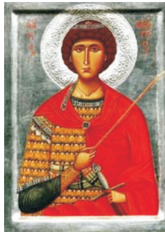
Св. муч. Георгий Победоносец Современная икона.

Св. мученик Георгий Победоносец , родом из Каппадокии, получил хорошее воспитание, был военачальником при императоре Диоклетиане. Существует легенда, что в храме Аполлона св. Георгий сотворил крестное знамение, и все скульптуры идолов рухнули. На совете у императора он стал защищать христиан и был подвергнут жестоким пыткам, затем казнен. Царица Александра, заступившаяся за Георгия и принявшая веру, была казнена вслед за Георгием.