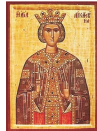
Св. великомученица Екатерина