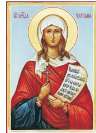
Св. мученица Татиана

Свв. великомученицы Екатерина и царица Августа пострадали в гонение при Диоклетиане. Екатерина происходила из знатного александрийского рода и отличалась незаурядным умом и красотой. Отказавшись от замужества, она стала христианкой. Максимин, соправитель Диоклетиана, заключил ее в темницу за «неуважение» к языческим богам. Он устроил специальный совет