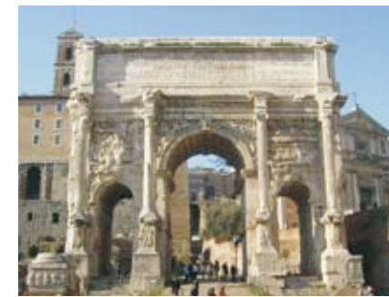
Рим: Арка Септимия Севера, 203 г.

Период второй. Христианство как недозволённая религия. После смерти Домициана наступает царствование Антонинов. В это время положение христиан значительно ухудшилось. С христианства