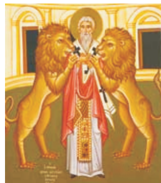
Свщч. Игнатий Богоносец

Св. Игнатий, епископ Антиохийский (Богоносец) , был учеником ап. Иоанна Богослова и, будучи епископом, управлял Антиохийской церковью более 30 лет. В 107 г. император Траян, отправляясь на войну с персами, прибыл в Антиохию. Язычники Антиохии устроили по этому случаю праздника, во время которых Игнатия по доносу привели к императору и спровоцировали допрос на предмет веры. После допроса Траян, не добившись от св. Игнатия отречения от христианства, приказал